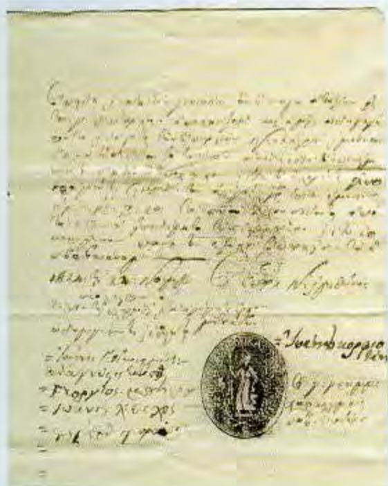
1. Νεόκαστρο, 24/11/1824.