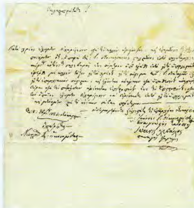
2. Νεόκαστρο, 8/12/1824.

Εγγραφο του επαρχείου Νεοκάστρου-Μεθώνης. Απόφαση των Δημογερόντων και Επιστατών για την πληρωμή του πολιτάρχου από τα εθνικά εισοδήματα.