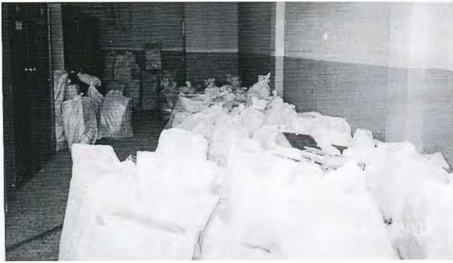
Εικόνα 1. Σάκοι με αρχειακό υλικό της Νομαρχίας Λακωνίας