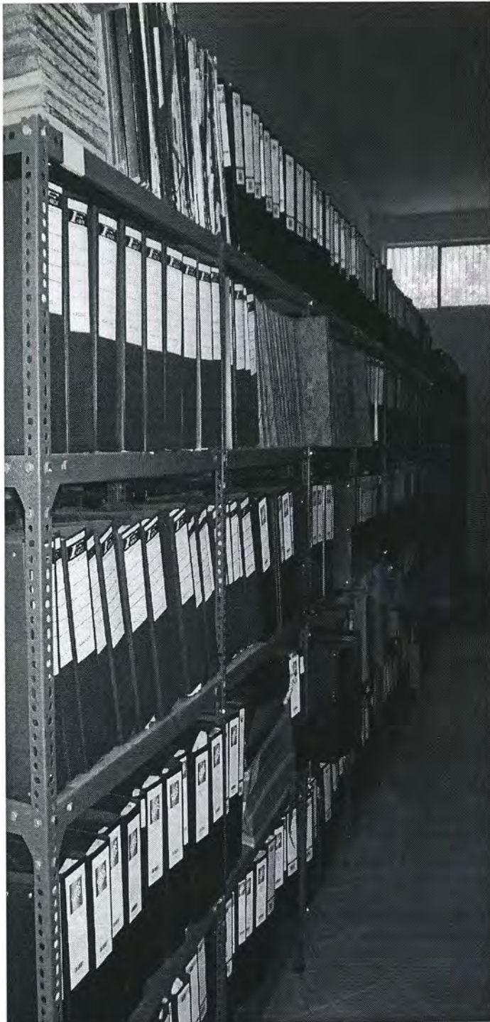
Εικόνα 2. Αρχαιοστάσια: Τμήμα των Αρχείων της Νομαρχίας Λακωνίας όπως φυλάσσεται σήμερα στα Γ.Α.Κ. – Αρχεία Ν. Λακωνίας

Η πρόσκτηση του ιστορικού, ανενεργού ή εκκαθαρισμένου αρχείου της Νομαρχίας Λακωνίας έγινε σταδιακά από το 1995 μέχρι σήμερα.